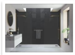
AYO Colour Walk In per due con barre di stabilizzazione - in Ottone spazzolato.jpg