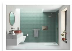
AYO Colour Walk In Soluzione singola a un lato con punto di fissaggio Nichel spazzolato.jpg