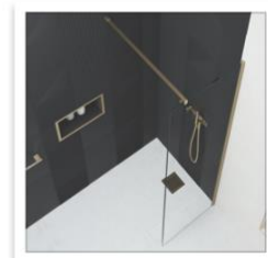
AYO Colour Walk In con barra di stabilizzazione dritta in Ottone spazzolato.jpg