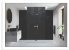
AYO Colour Walk In - Soluzione con doppia entrata - ottone spazzolato.jpg