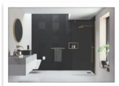
AYO Colour Walk In Soluzione a 1 lato con punto di fissaggio perpendicolare - ottone spazzolato.jpg