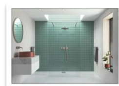
AYO Colour Walk In doppia soluzione con barre di stabilizzazione in Nichel spazzolato.jpg