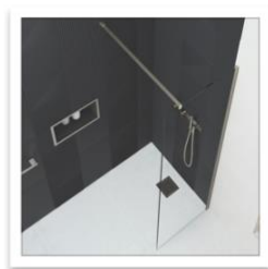
AYO Colour Walk In con barra di stabilizzazione dritta in Nichel spazzolato.jpg