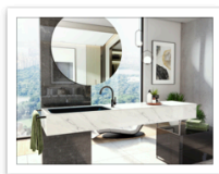
Harley Onyx PVD OX ambiente 2