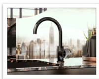
Harley Onyx PVD OX

BB - Latón cepillado PVD, PB - Latón pulido PVD, RG - OR'osa PVD®, BRG - OR'osa cepillado PVD®, BOX - Onyx cepillado PVD®, OX - Onyx PVD®