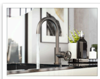
Harley BNi Níquel cepillado, PC