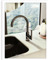
Harley lever OX.jpg