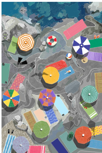
Punta SanLorenzo installazione