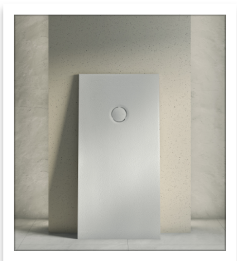
FIORA Piatto doccia Selene

Il riutilizzo dei solventi e il conseguimento della certificazione ISO 14001 testimoniano l'approccio sistematico e responsabile di Fiora alla sostenibilità. Queste azioni, insieme all'introduzione innovativa di Silica Free, non solo sottolineano la qualità e l'estetica delle soluzioni per il bagno, ma rafforzano anche l'impegno di Fiora per la tutela dell'ambiente e il benessere della comunità, consolidando la sua posizione di leader del settore e di marchio realmente impegnato per un futuro più verde e sostenibile.