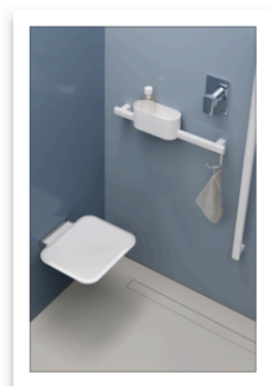
OMNIA_ Ponte Giulio_Dettaglio total white.jpg